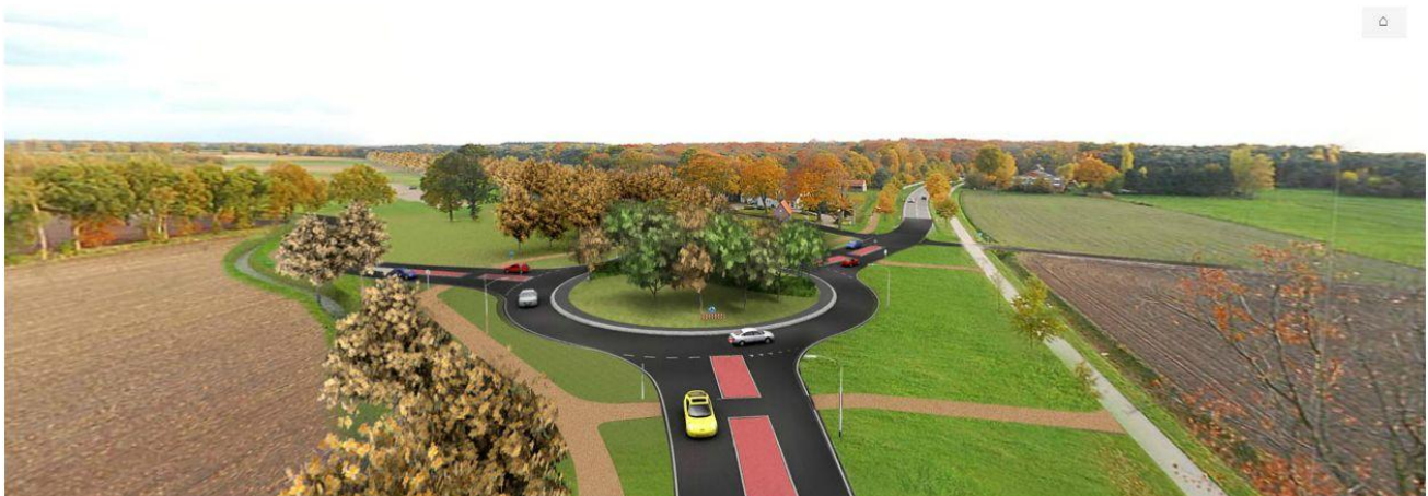
Afbeelding 2 Rotonde N260 - N639 Chaamseweg Baarle-Nassau

De provinciale gebiedsontsluitingsweg N639 loopt als een drukke verkeersader door het centrum van Chaam met een belasting van meer dan 10.000 verkeersbewegingen per dag en welke jaarlijkse toenames. Het is zeer aannemelijk dat het aantal verkeersbewegingen sterk zal toenemen, zodra de randweg N260 in Baarle-Nassau is gerealiseerd (medio 2018). Zie hieronder de rotonde, tussen de Gaarshof en de entree Baarle-Nassau, die beide wegen verbind.